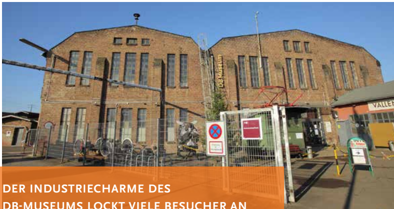
DER INDUSTRIECHARME DES DB-MUSEUMS LOCKT VIELE BESUCHER AN

Während des Dampfspektakels ist das DB-Museum am 28. und 29. April geöffnet. Passend zum Dampfspektakel zeigt Ihnen das DB-Museum eine umfangreiche Sammlung historischer Originalfahrzeuge, unter anderem Salonwagen, in denen Persönlichkeiten wie Queen Elisabeth, Charles de Gaulle und die Beatles gefahren sind. Sie erreichen das Museum zu Fuß vom Bahnhof Koblenz-Lützel (2 km Fußweg) oder vom Hauptbahnhof Koblenz aus mit der Buslinie 354 in Richtung Mülheim-Kärlich (am 28. April stündlich, am 29. April alle 2 Stunden). TIPP: Für Besucher mit einer Fahrkarte des Dampfspektakels gilt ein vergünstigter Eintrittspreis in Höhe von 2 Euro (Kinder 1,50 Euro)