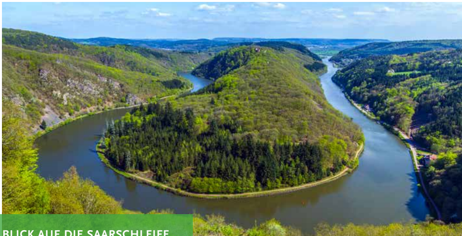
BLICK AUF DIE SAARSCHLEIFE

Und wenn Sie schon mal da sind, wollen Sie sicher nicht nur eine Strecke fahren oder eine bestimmte Lok hautnah erleben – für einen Tag ist die Anreise doch viel zu schade. Bleiben Sie einfach ein paar Tage lang in der Region! Ein verlängertes Wochenende in Trier, an der Saar oder in der Eifel bietet neben der Teilnahme am Dampfspektakel noch viel mehr. Vorschläge für Ausflüge finden Sie bei der Rheinland-Pfalz Tourismus GmbH sowie der Tourismus Zentrale Saarland GmbH. Beispielsweise bieten sich die Vulkaneifel und der Nationalpark Hunsrück-Hochwald für interessante Tagestouren an. Informieren Sie sich unter: www.urlaub.saarland