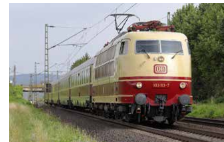
UNTERWEGS AUCH IN SCHWEICH UND WITTLICH: 103 113-7

Im Bahnpostwagen (Bpw) können Sie sich ein Bild von dem ehemaligen Dienstzweig inkl. Transport und Sortierung machen, welcher von 1848 bis 1997 auf deutschen Schienen anzutreffen war. Der Bpw ist mit allen dazugehörigen Utensilien eingerichtet. Für jedes Zugpaar gibt es an allen Tagen zudem einen Bahnpost-Cachet-Stempel. Im Fahrplan erkennen Sie am Posthorn, bei welchen Fahrten der Bahnpostwagen zum Einsatz kommt. Beim Bahnpostwagen können Sie auch Ihre Erinnerungspost vom Dampfspektakel aufgeben!