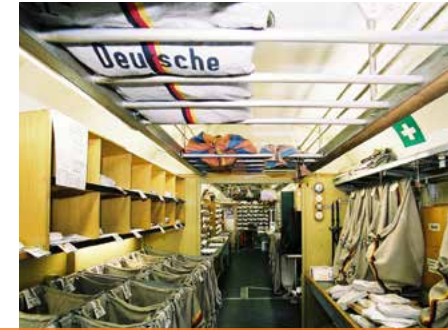
BLICK IN DEN BAHNPOSTWAGEN

Im neugestalteten Kurpark empfängt Sie die Tourist-Information Gerolstein mit einem Info-Zelt und einem gastronomischen Angebot zu erschwinglichen Preisen. So können Sie mit Blick auf die alten Loks das hoffentlich schöne Wetter bei Kuchen und Snacks genießen. Zudem werden kostenlose Führungen durch Gerolstein und die einzigartige Erlöserkirche angeboten.